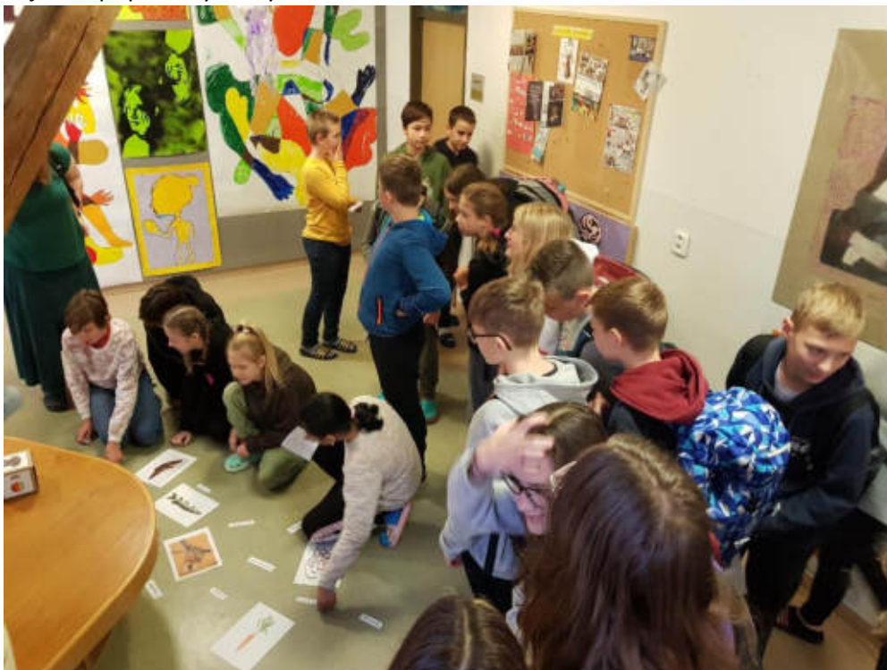
Část menších studentů zvolila taktiku dle rčení: „Kdo nic nedělá, nic nezkaží.“