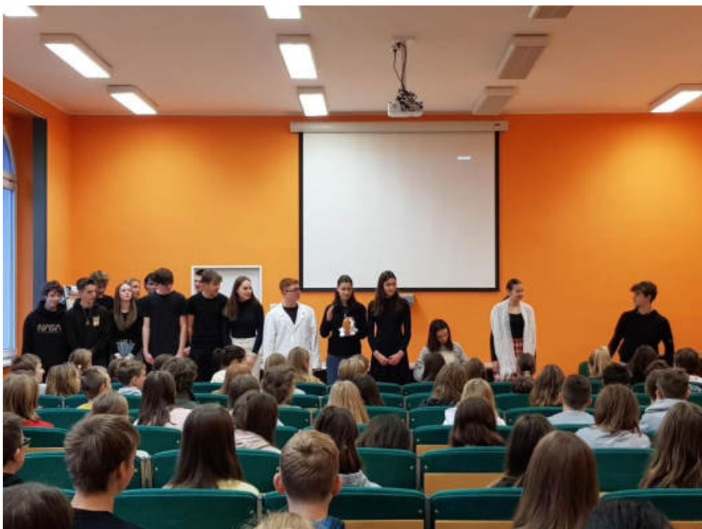
Tysdopad, blázinec? No kdo to kdy slyšel..