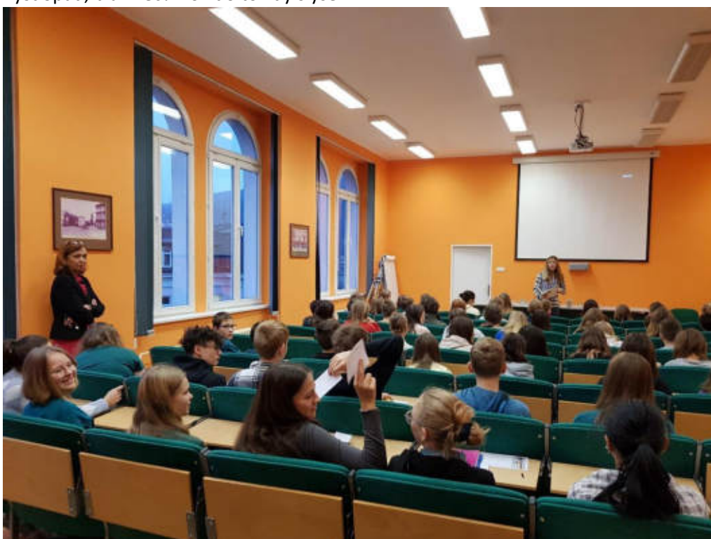
První představení probíhalo pod důkladným dohledem paní ředitelky.