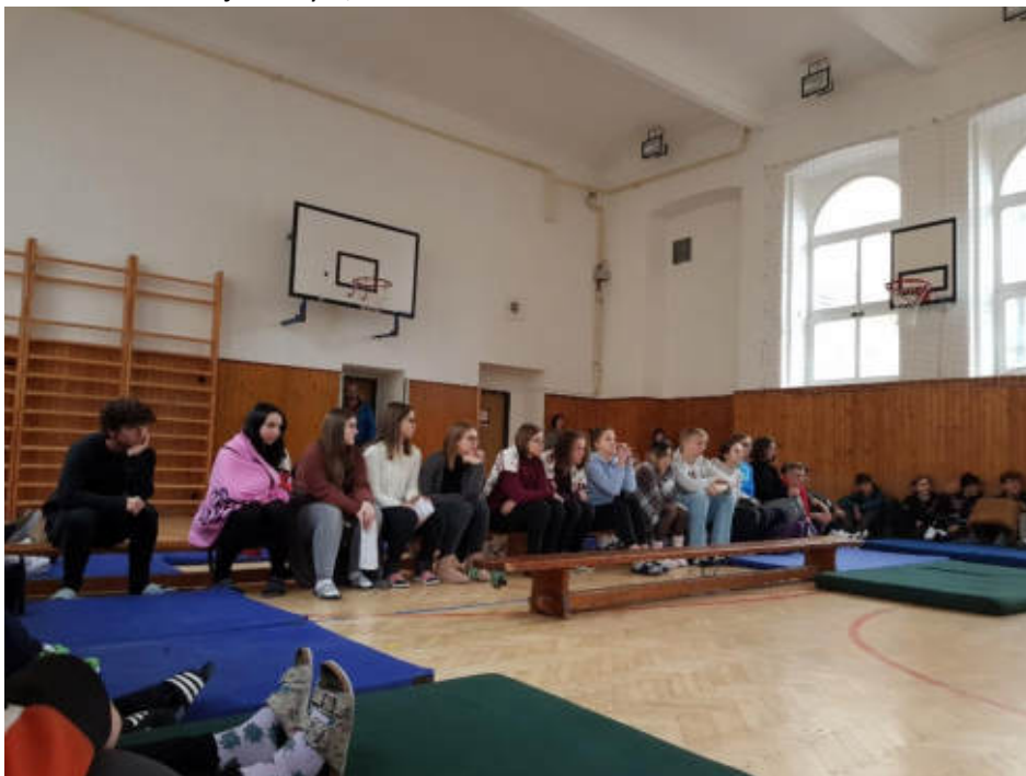
Zapojení studentů v chladné tělocvičně bylo opravdu hojné.