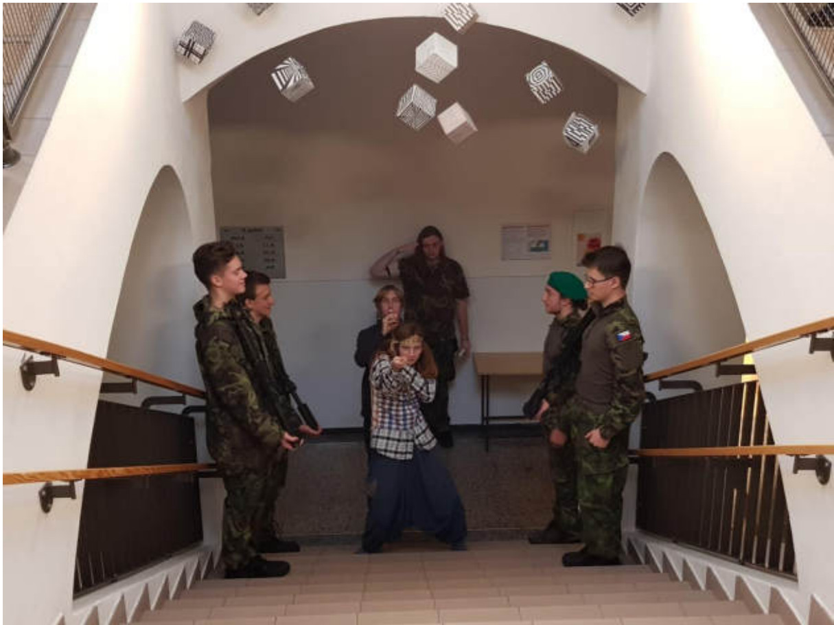
Hlavní moderátorka programu v aule byla po celé trvání přestávky bedlivě chráněna pohotovým vojskem připraveným kdykoliv zasáhnout