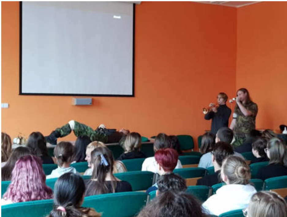
Jen koleno na bojišti zbylo, nic víc.