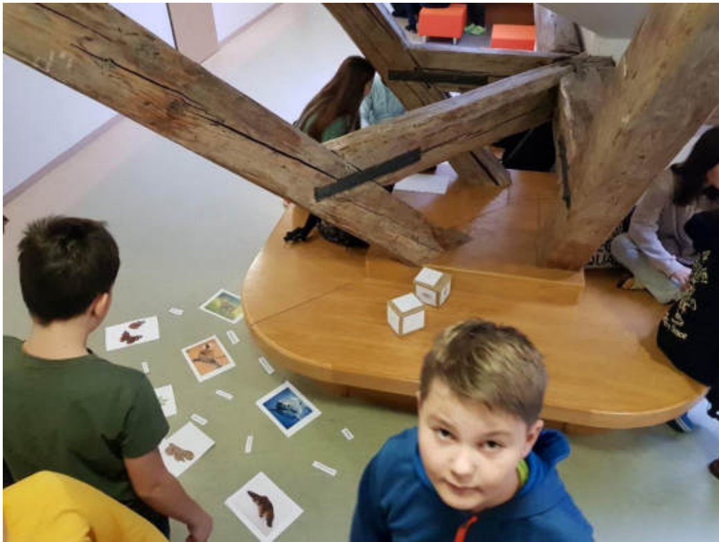
Údiv z fotodokumentace byl opravdu velký.